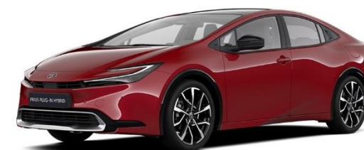
3U5 – Emotional Red Metallic

Die Preise sind unverbindliche Preisempfehlungen des Herstellers ab Werk in Euro exkl. NoVA und MwSt. Erfahrungsgemäß können Druckfarben den Farbton von Lackierungen nicht originalgetreu wiedergeben.