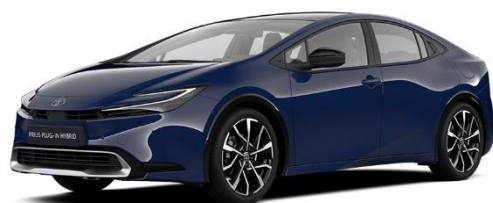
8Q4 – Indigo Blue