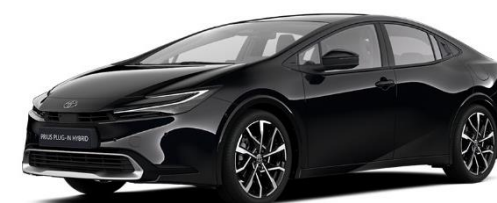
218 – Attitude Black Metallic