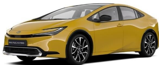
5C2 – Mustard Metallic