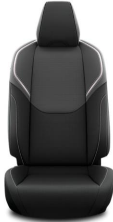
Sitzbezug Stoff, schwarz