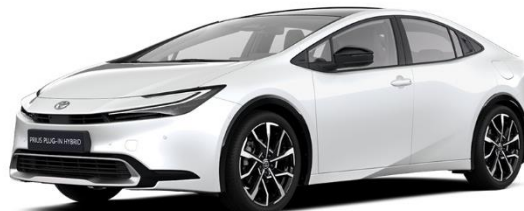
089 – Platinum Pearlwhite Metallic