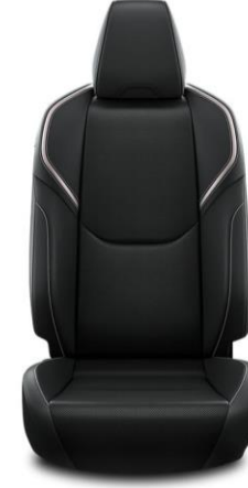
Sitzbezug Ledernachbildung, schwarz