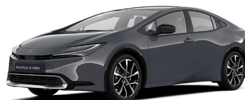
1M2 – Ash Metallic