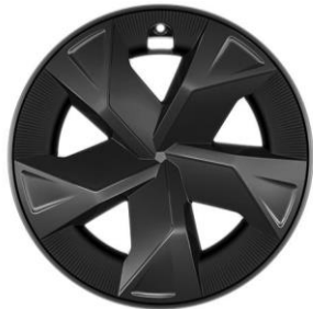
17" Leichtmetallfelgen mit Aerodynamik-Radabdeckungen in Dunkelgrau