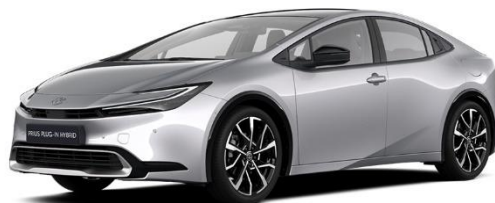
1L0 – Shimmering Silver Metallic