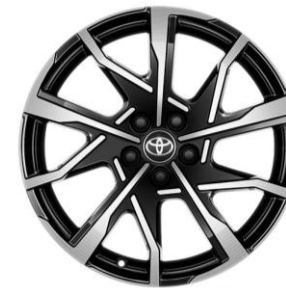
19" Leichtmetallfelgen in Schwarz, poliert